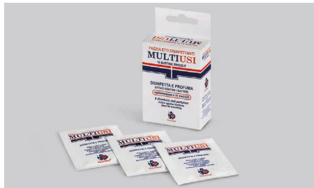
Q409 – Desinfektionstücher aus Vliesstoff.