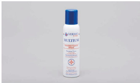
Q409 – Desinfektionsspray (150ml).