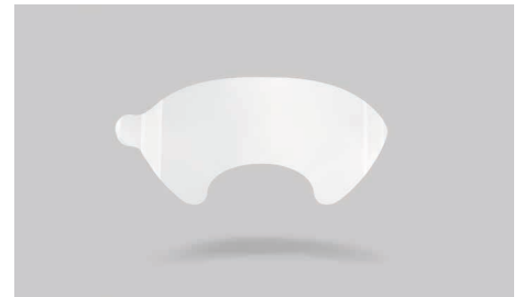
K19 – Acetat-Schutzfolie.