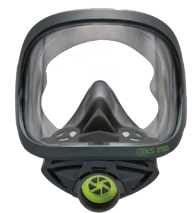
Vollmasken BLS 2150/2150V