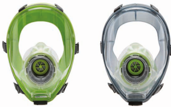
Vollmasken BLS 5400 - BLS 5150