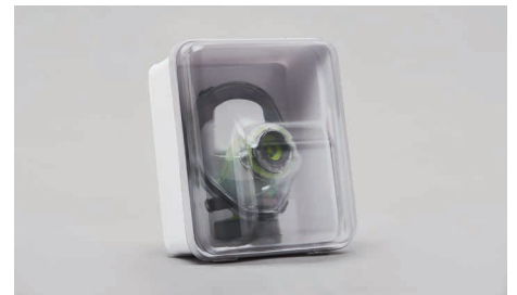
C90 – Wanzbehälter.