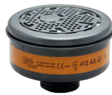
Filter BLS 400 Serie