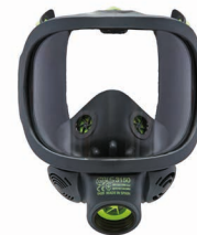
Vollmasken BLS 3150