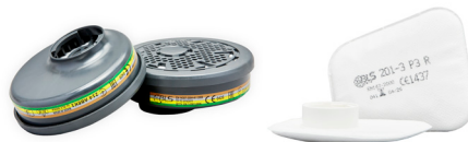
Filter BLS 200 serie Filter BLS 201 serie