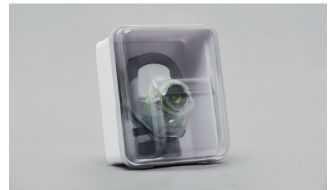
C90 – Wanzbehälter.