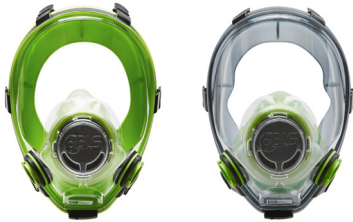
Vollmasken BLS 5700 - BLS 5600