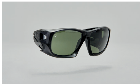
C22 – Rahmen für Korrekturgläser.