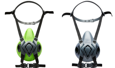
Halbmasken BLS 4000next S - BLS 4000next R