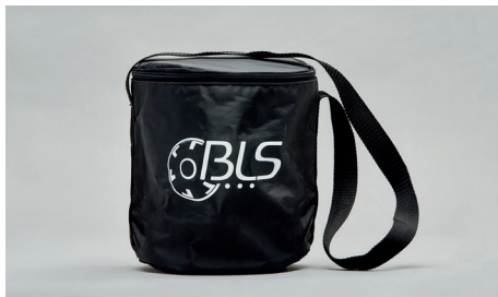
C43 – Stofftasche für Halbmasken.