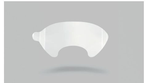
K19 – Acetat-Schutzfolie.