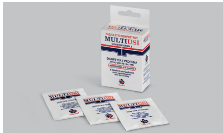
Q409 – Desinfektionstücher aus Vliesstoff.