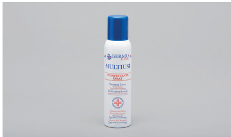
Q409 – Desinfektionsspray (150ml).