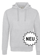
024 ash meliert