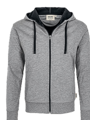
015 grau meliert/tinte