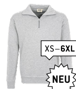
024 ash meliert