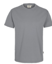
443 hp titan