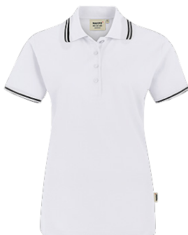
001 weiß / schwarz