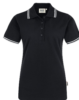
005 schwarz / weiß