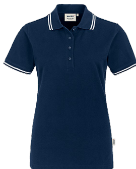
034 tinte / weiß