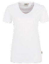
401 hp weiß

Ursprungsland Laos Zolltarifnummer 6109 9020 Datenblatt Stand: 02/2023