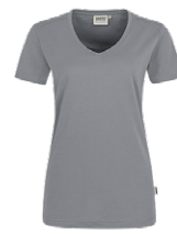
443 hp titan