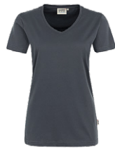
428 hp anthrazit