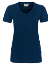
434 hp tinte