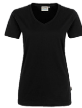
405 hp schwarz